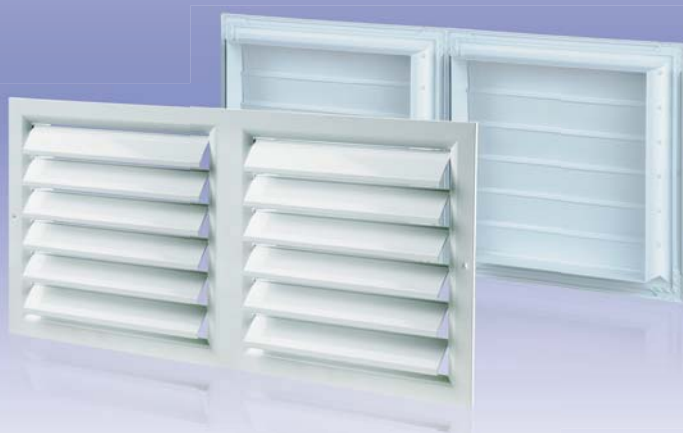
Секционная вентиляционная решетка с гравитационными жалюзи